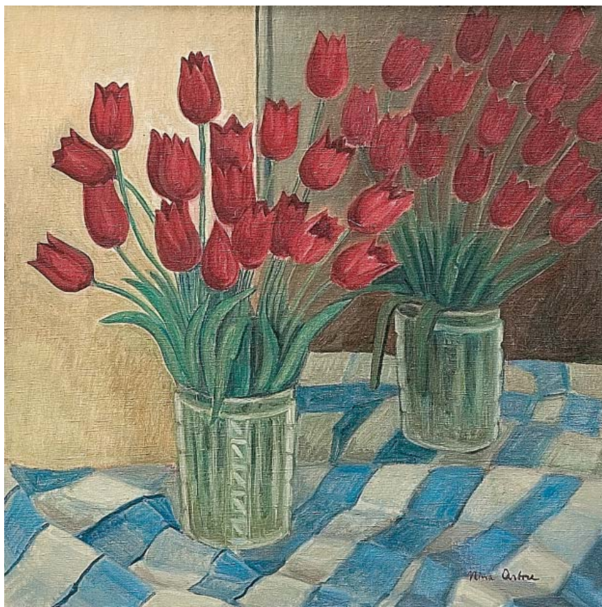
Nina Arbore. Lalele , ulei pe pânză, 505 x 505 mm. Colecția Muzeului Municipiului București